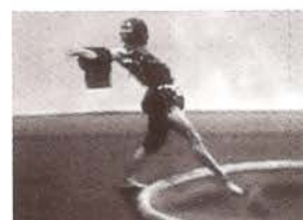
La danza del gavilán, 1979.