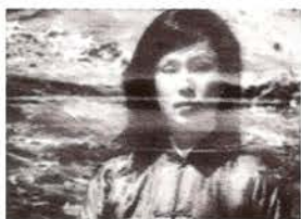
El segundo día, 1988.

Asociación y disociación de imágenes que siguen el ritmo discontinuo de la música de Zorn: una ciudad, Nueva York, que se mueve a toda velocidad, se ralentiza, se detiene, vuelve a arrancar... Osciloscopio, imágenes coloreadas, sobreimpresiones, aceleraciones y cámara lenta configuran un universo de contrastes y transiciones.