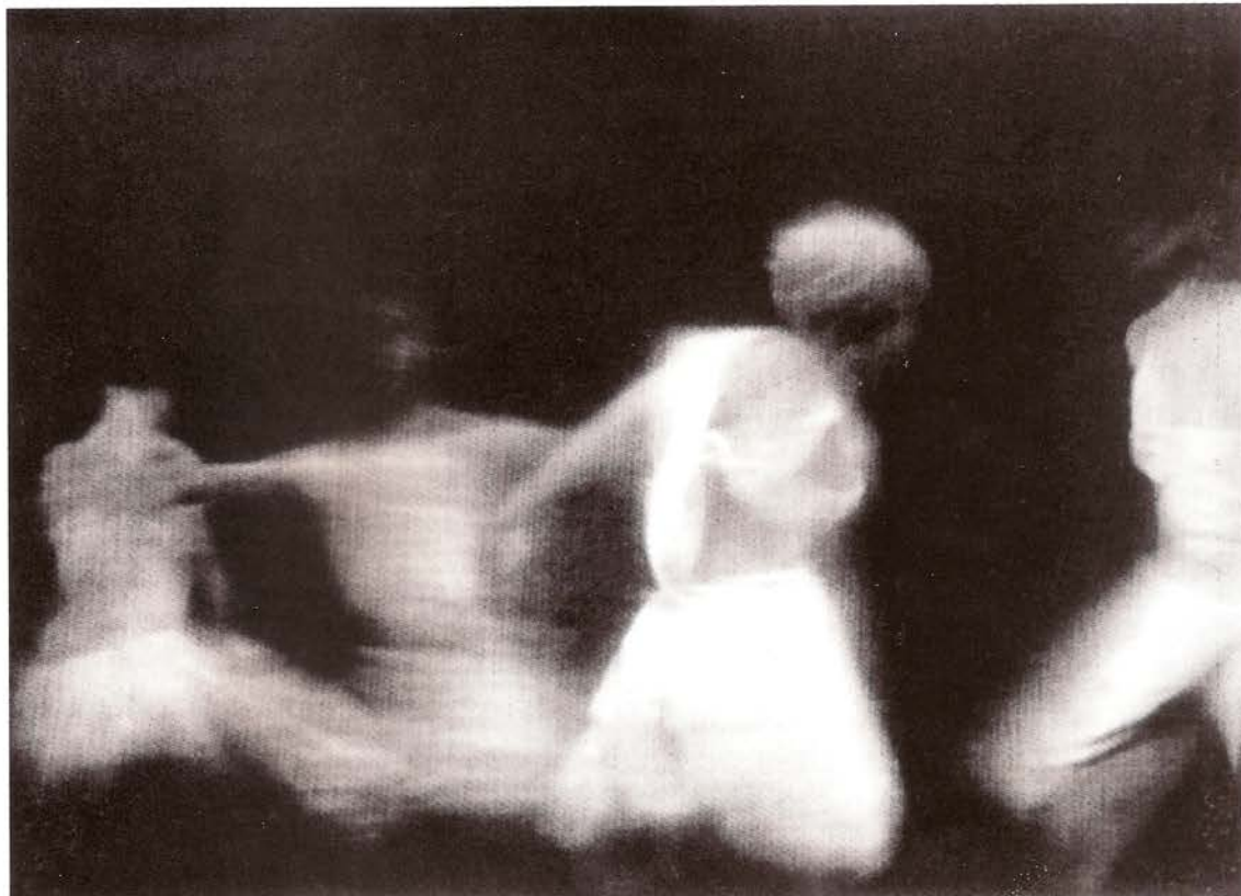
Parcela de cielo, 1987.