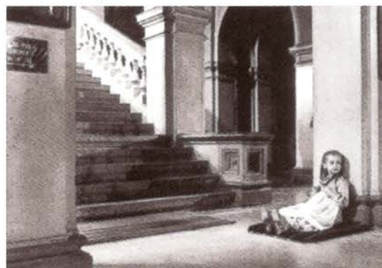
Arrêt sur marche , 1979.