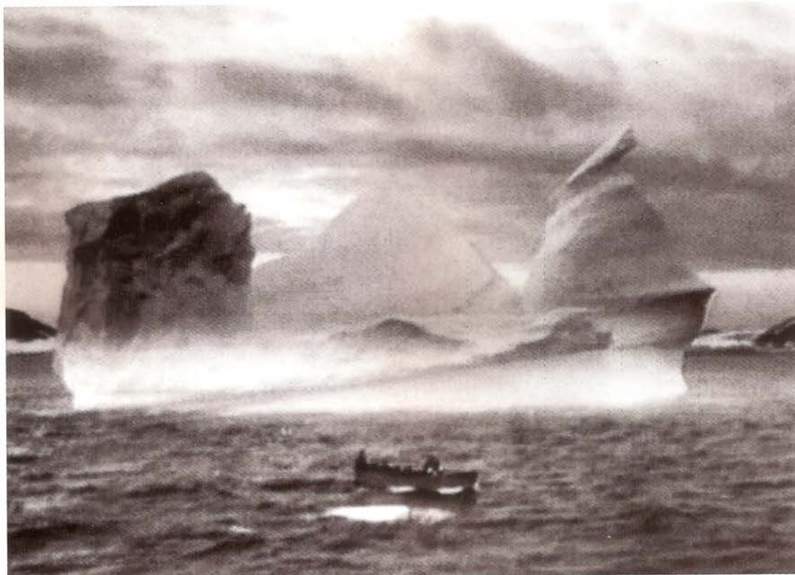
Viaje de invierno, 1993.