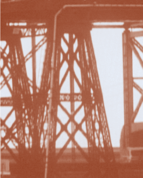
The Light at the Edge of a Nightmare