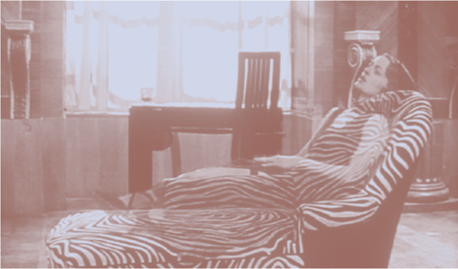
Arriba: The Invention of Dr. Morel . Foto portada: The Light at the Edge of a Nightmare .

Programa de cine y vídeo presentado en David Lamelas: espacio/tiempo/ficción en la Sala Rekalde de Bilbao del 15 de julio al 19 de septiembre de 2004