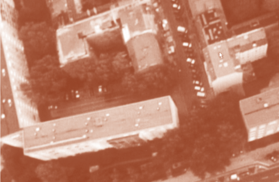
Time as Activity, Düsseldorf