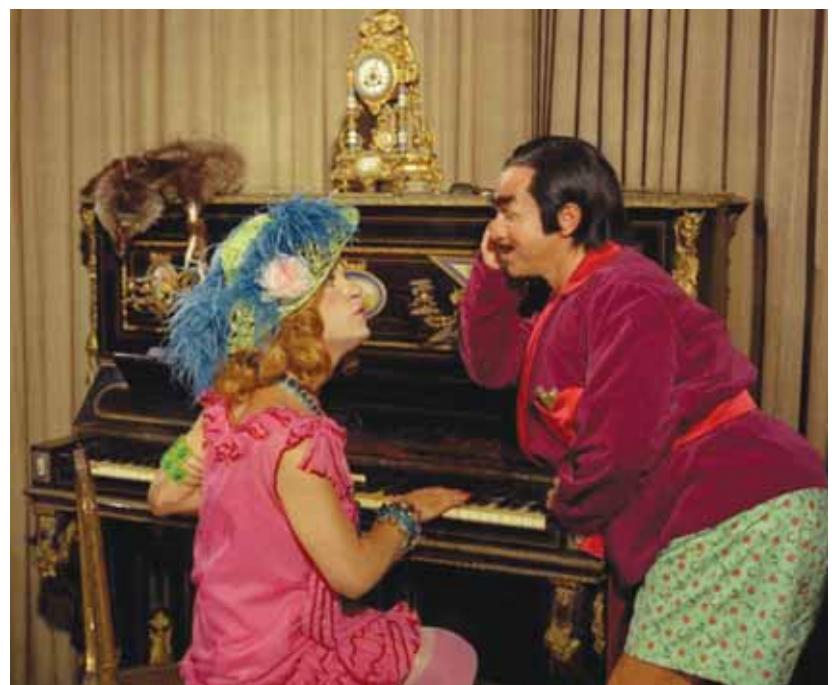
Joaquim Pedro de Andrade, Macunaíma

El samba nació en las favelas de Río de Janeiro. Inspirado por los ritmos negros de la región de Bahía, es el reflejo de una sociedad mestiza forjada por olas sucesivas de inmigración. El filme nos muestra los diferentes géneros del samba, desde los más clásicos, como el samba de carnaval, hasta ejemplos recientes en los que se mezcla con el reggae y el sonido disco.