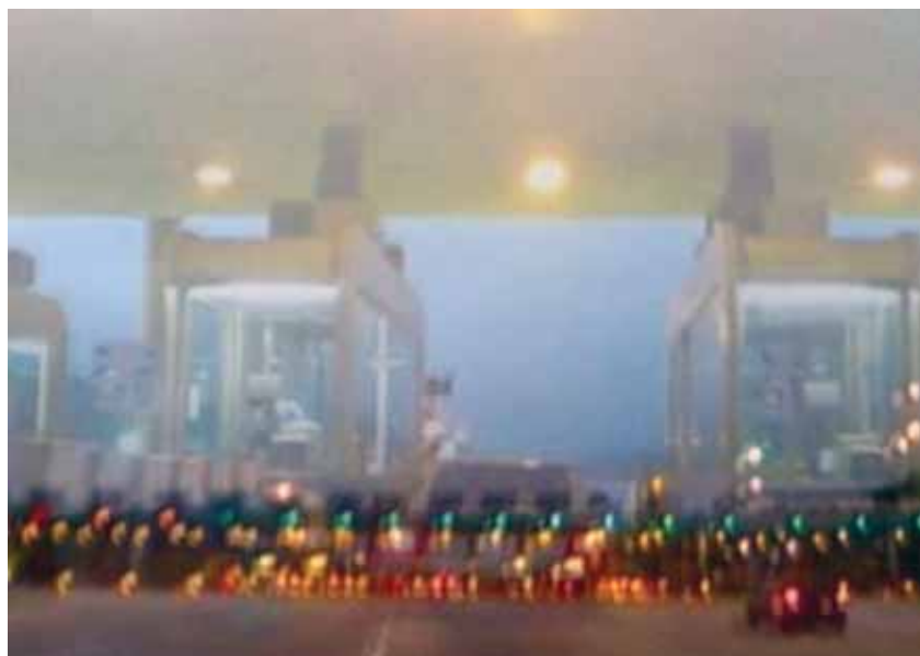
Giselle Beiguelman, Tunnelscapes

Domingos 27 de enero y 3, 10, 17 y 24 de febrero, a las 13 h. Duración aproximada: 67'