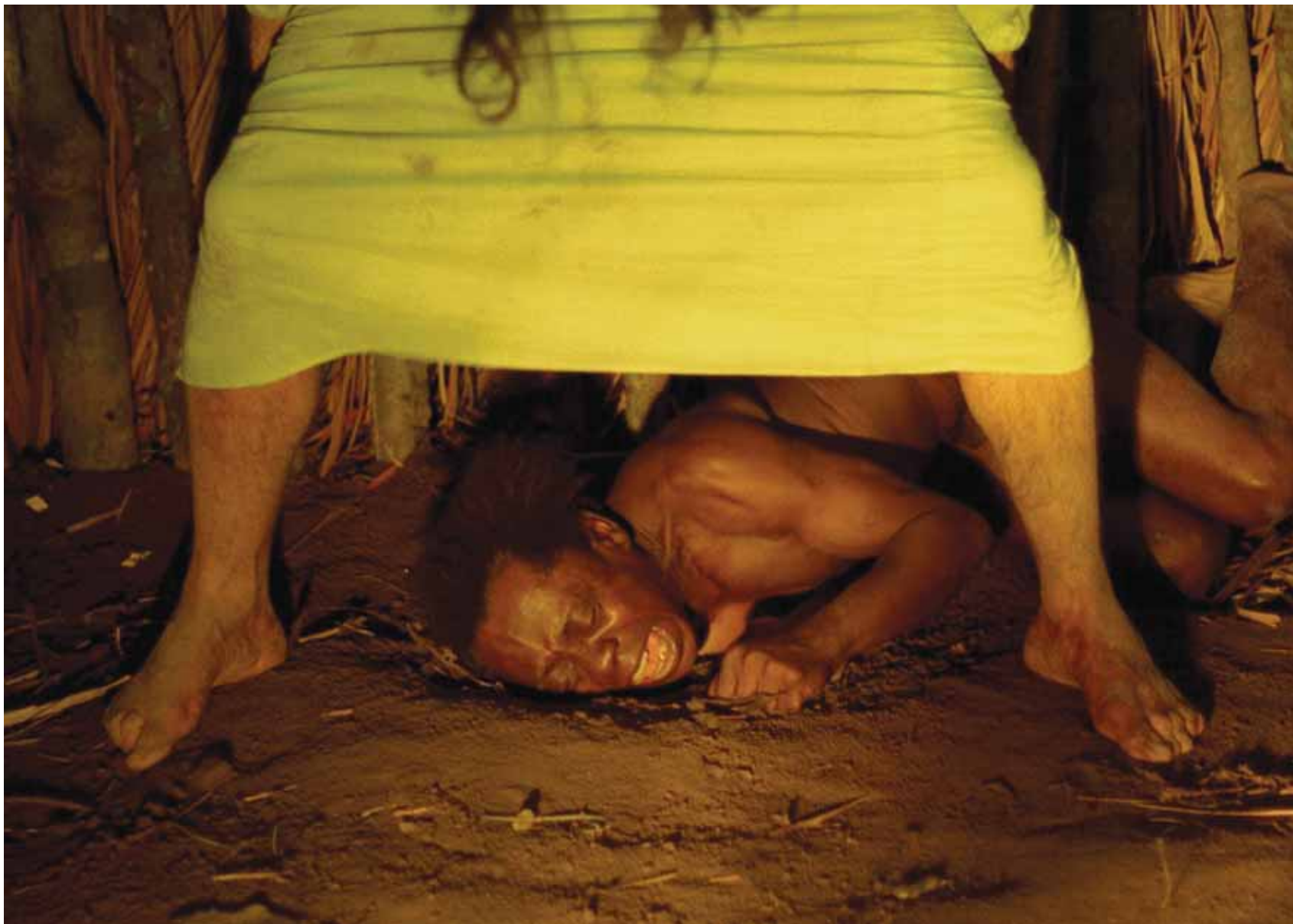
Joaquim Pedro de Andrade, Macunaíma

de 1942. Sylvio Back estará en el museo para hablar de su obra, así como Fabiano Maciel y Dominique Drefuys.