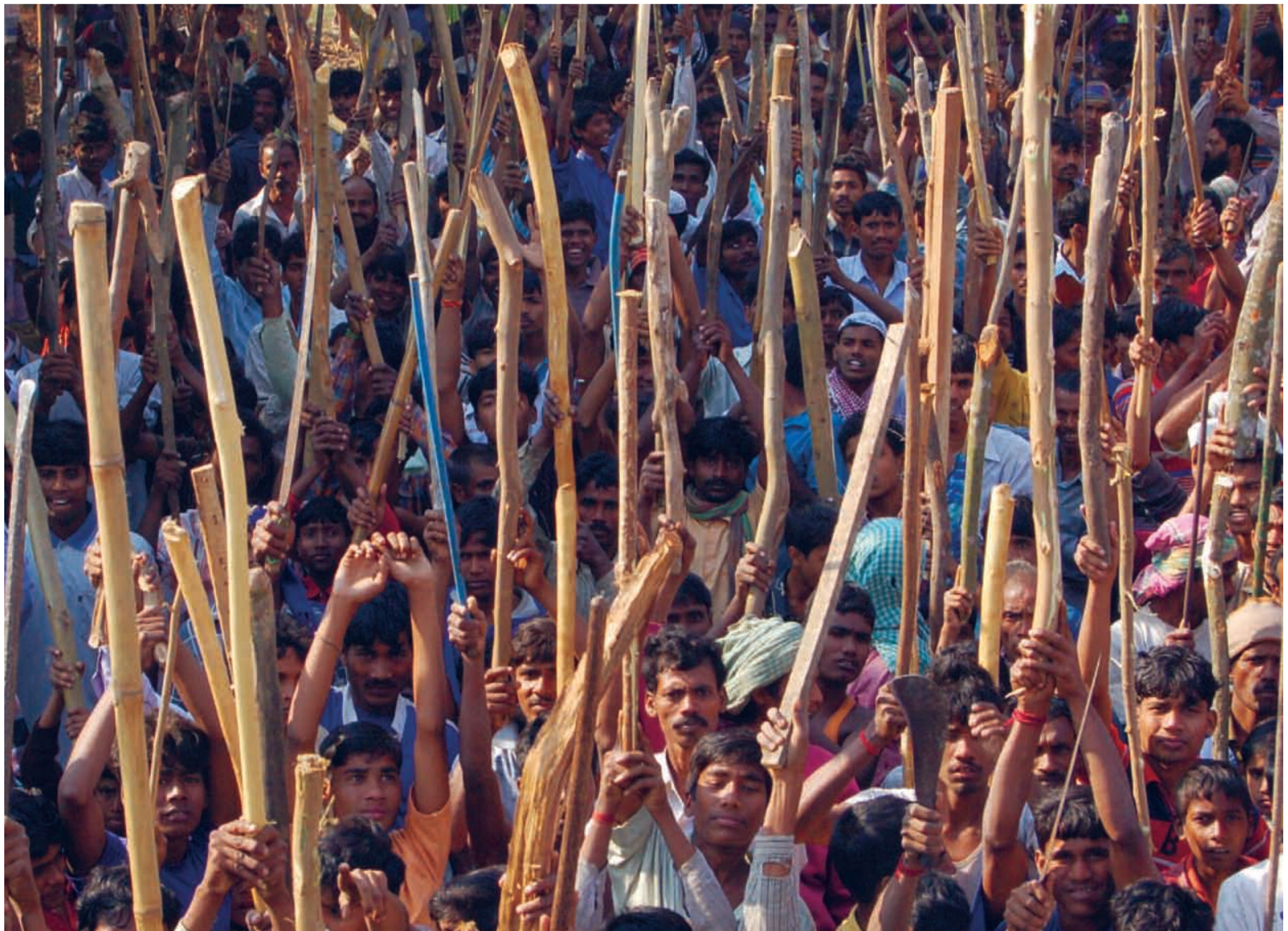
Development at Gunpoint

Kaal Abhirati en lengua oriya, significaría literalmente, "adicción" u "obsesión" por el tiempo. Unos niños entran en el plano a intervalos periódicos vaciando cubos de agua en un jardín. Entran y salen. El espectador se enfrenta a su tiempo real. Este primer plano secuencia marca el ritmo y constituye la misma película. En palabras de su director "es como si observásemos el pasado, el futuro y el presente en un mismo instante con cada parpadeo de nuestro ojo (...) mantengo la duración justa de cada plano para que complete el tiempo que el espectador experimenta viendo la película".