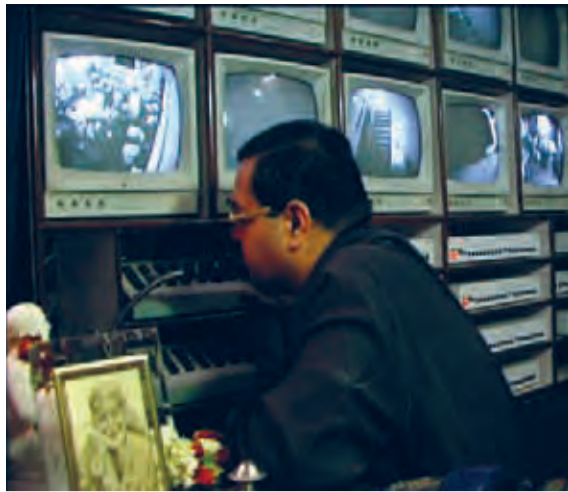
The Great Indian School Show

A partir de conversaciones mantenidas con diversos cineastas, críticos y actores se pretende dar a conocer en nuestro medio la enriquecedora realidad del cine en la India. El documental aborda temas relacionados con la censura, el papel de la mujer en la industria cinematográfica, la llegada de la globalización a través de las productoras del cine americano y la presencia, cada vez mayor, de los multicines en los grandes centros comerciales.