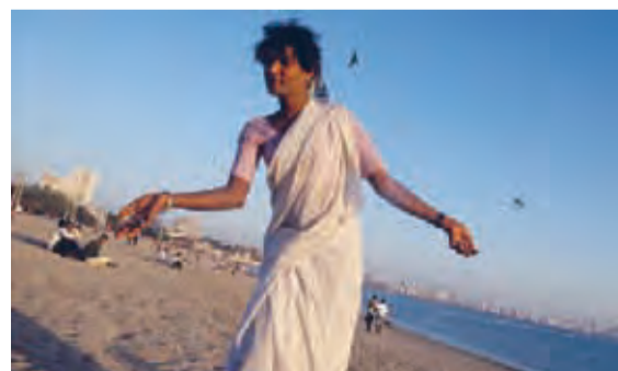
Between the Lines...