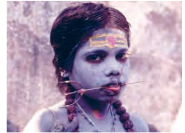
Forest of Bliss

A través de una fotografía transfiguradora, el documental que carece de narrador, subtítulos o diálogos, transmite al espectador una sensación totalmente auténtica y le hace partícipe de las intensas experiencias reflejadas en la película.