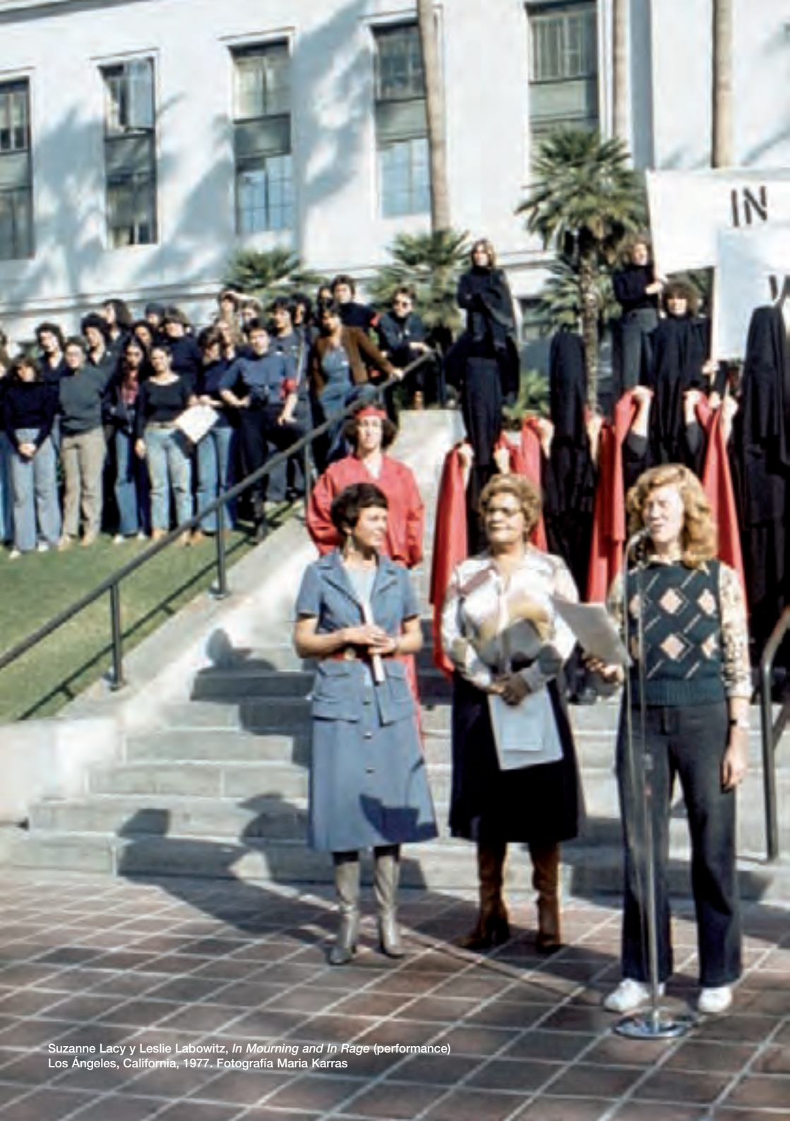
Suzanne Lacy y Leslie Labowitz, In Mourning and In Rage (performance) Los Ángeles, California, 1977.