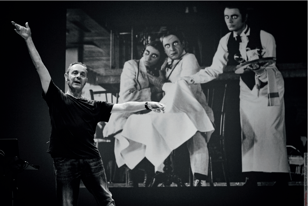
Una conferencia bailada.

Como parte del ciclo de artes escénicas diseñado en colaboración con Teatros del Canal de la Comunidad de Madrid, el Museo Reina Sofía presenta Una conferencia bailada de Toni Jodar, adelantándose así a la celebración del Día Internacional de la Danza.