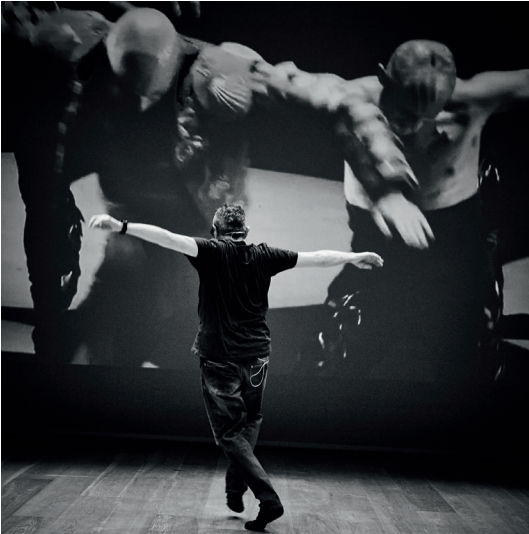
Una conferencia bailada.

En el plano internacional, destaca la presentación de Modern Dance Speaks! en el Sadler’s Wells de Londres (2012 y 2014) y en varias ciudades de China (2013 y 2014).