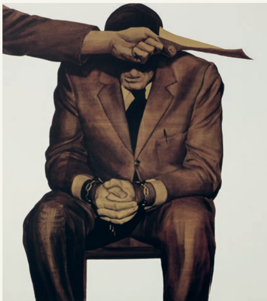
Juan Genovés, Documento n° ... , 1975

Esta planta cuenta la historia del arte de los últimos cincuenta años a partir de una selección de obras de las colecciones del Reina. ¿Es el pasado el camino hacia el presente o su memoria ofrece errores y caminos de no retorno frente a los futuros por construir? O mejor, ¿cómo se llega al pasado desde el presente? La tarea de un museo nacional no es releer el pasado buscando un espejo para la sociedad actual, sino permitir que las preocupaciones del presente encuentren en aquel una multitud de respuestas que permitan comprender que el hoy no es algo dado sino un llegar a ser de construcción necesariamente colectiva. En épocas inciertas, no se trata de imaginar futuros, sino de intentar reconocer en el presente aquellos futuros deseables que ya estaban aquí.