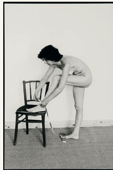
Esther Ferrer, Íntimo y personal , 1977. Atelier Lerin, París.

A medida que avanza la década de los 2000, la traducción del conceptualismo en términos de crítica de la representación consolida la figura del artista multidisciplinar, sobre la que ironiza el vídeo de Carles Congost, que cuenta las hazañas de un futbolista que decide abandonar el balón para convertirse en videoartista. Los síntomas de una necesidad de regeneración de la tradición y la recuperación de olvidos flagrantes en la historia del arte expanden también los límites de las convenciones. Los museos, como instituciones democráticas, responden a los esfuerzos por ganar visibilidad de las nuevas presencias sociales en un arte contemporáneo atravesado por todos los conflictos identitarios que marcaron el siglo xx y que se convierten en un aspecto central de la convivencia social en el siglo xxi.