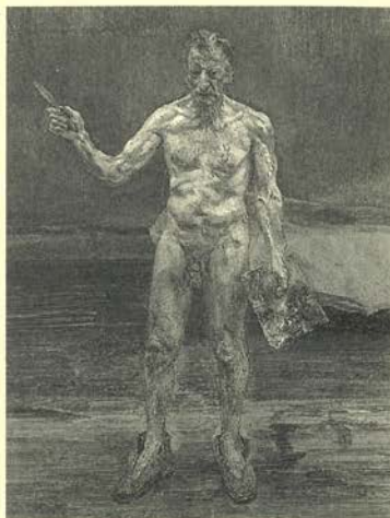
5. Pintor trabajando, reflejo, 1993

Oleo sobre lienzo 101,25 x 81,75 cm Colección particular