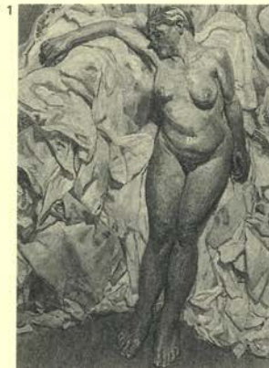
1. De pie junto a los trapos , 1988-89 Oleo sobre lienzo 168,25 x 138,5 cm Tate Gallery, adquirido con aportaciones del National Art Collections Fund, los Amigos de la Tate Gallery y donantes anónimos, 1990

Ib y su marido se desarrolla en un rincón del estudio del pintor. Las manchas de gruesa textura tras las figuras representan años a lo largo de los cuales el artista ha ido sacudiendo de sus pinceles el exceso de pintura mientras trabajaba en otros cuadros.