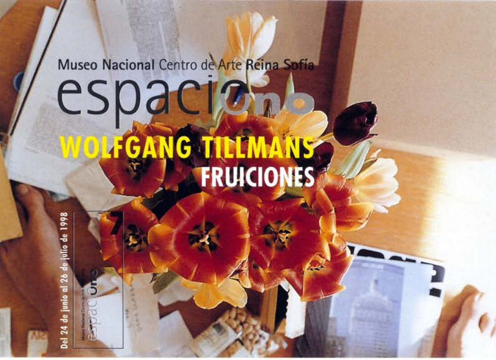
Nsoya tulips, 1997

Museo Nacional Centro de Arte espacio uno