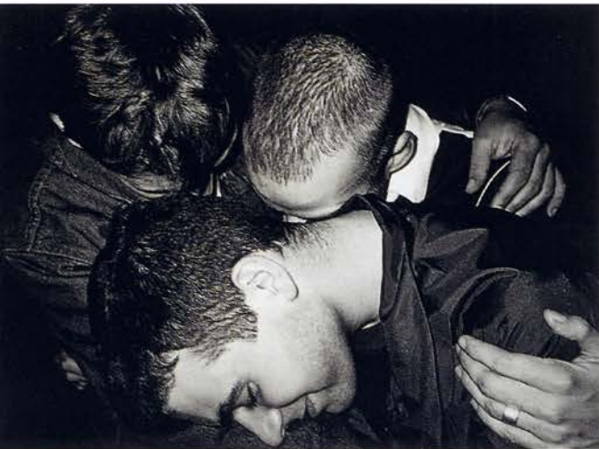
Arkadia 1, 1996