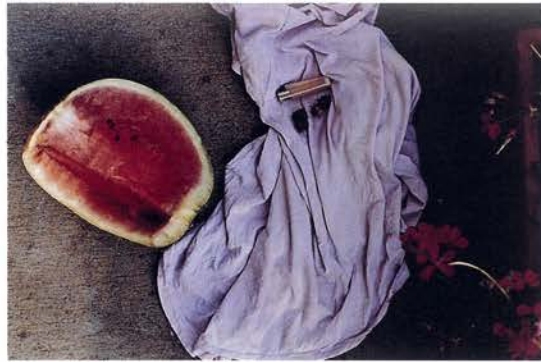
Stilleben Nüßchen 1, 1997