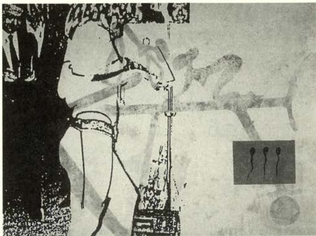
A Expêriencia Que Produz a Escrita , 1989. Técnica mixta sobre lienzo, 160 x 220 cm. Fundação Carmona e Costa, Lisboa.

La exposición ha sido concebida como una retrospectiva que evita una lectura lineal y cronológica, y utiliza la estructura cinematográfica para analizar y articular las obsesiones y motivos sobre los que gira la obra de Sarmiento -la memoria y el deseo- a través de 116 piezas en distintos soportes, pintura sobre lienzo, dibujos, cine, vídeo y diapositivas. Para esta ocasión se ha producido la obra Flashback , fruto de una colaboración entre Sarmiento y el músico Arto Lindsay, un tipo fragmentario de autobiografía con diapositivas que proceden del archivo del artista. Las imágenes del presente son memoria de un pasado. No hay cronología, ni narrativa, ni lógica aparente, solamente vistazos, sugerencias, instantáneas.