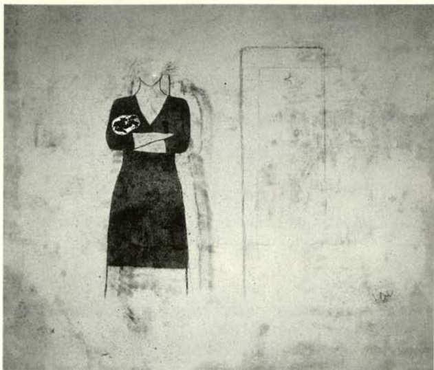
Febre (1) , 1995.

Técnica mixta sobre lienzo 190 x 220 cm.