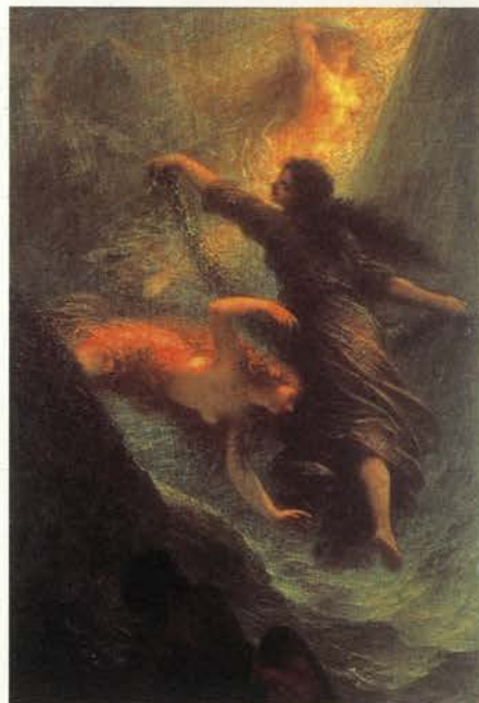
Henri Fantin-Latour, Escena primera de El oro del Rhin de Richard Wagner, 1888. Óleo/tela. 116,5 x 79 cm Hamburger Kunsthalle, Hamburgo

Antoni Gaudí es uno de los máximos exponentes del modernismo arquitectónico. Nació en Reus (Tarragona), en 1852, en el seno de una familia de artesanos. Cursó sus estudios de arquitectura en Barcelona y la mayor parte de su trabajo fue realizado en esta ciudad. Entre sus obras más emblemáticas se encuentran La Sagrada Familia, La Pedrera, Casa Milá, Casa Batlló y el Parque Güell. Murió a los 74 años atropellado por un tranvía. Su cuerpo fue enterrado en la cripta de La Sagrada Familia, la obra a la que dedicó las cuatro últimas décadas de su vida.