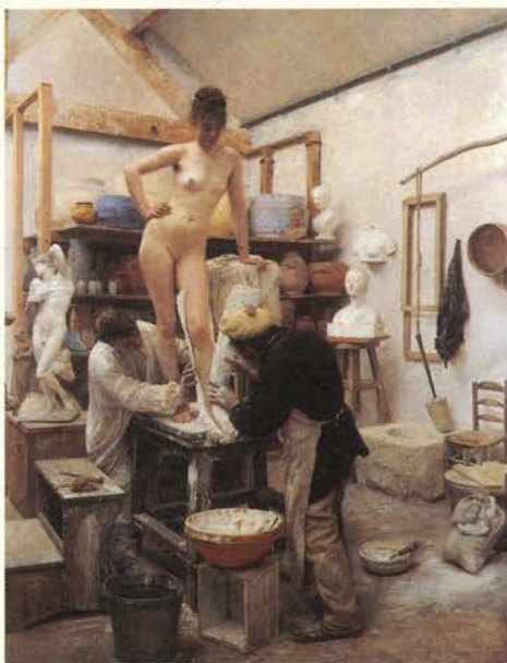
Édouard Dantan, Vaciado en yeso del natural , 1887 Óleo/tela. 165 x 131,5 cm Göteborgs konstmuseum, Gotemburgo

La exposición se estructura en tres secciones que no guardan una sucesión cronológica, sino que planteadas como estancias mentales nos sitúan frente a la diversidad y densidad del universo gaudiniano. Compuesta por cerca de 400 obras, los materiales originales de Gaudí se exhiben junto a un amplio repertorio de obras y documentos de otros artistas con el objetivo de acercarnos a la singularidad creativa de este arquitecto, enmarcándola en el contexto de su tiempo.