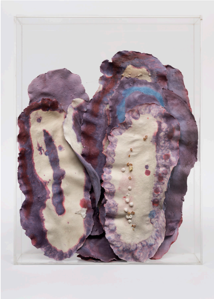
Algues blaves amb cargols [Algas azules con caracoles], 1986. Archivo Aurèlia Muñoz. Fotografia: Roberto Ruiz