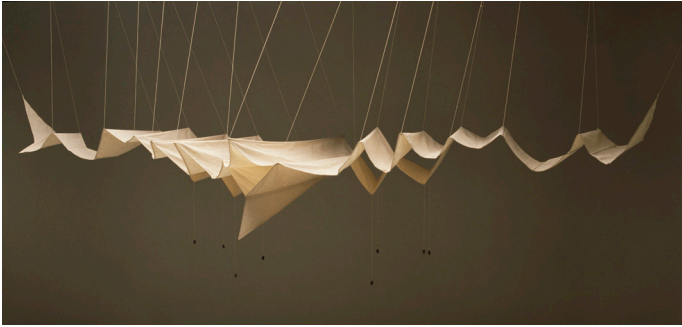
Ocell-estel B3 [Pájaro-cometa B3] , 1982. Colección Juan Varez.

a desarrollar una serie de esculturas voladoras similares a parapentes o aviones primitivos, hechas con grandes lonas articuladas por varillas. En sus formas vibran aún reminiscencias de las primeras experiencias plásticas de la artista cuando componía, en sus años escolares, animales de papel plegado. Al mismo tiempo, las esculturas que llamará “aerostatos” y “pájaros-cometas” —y que titulará con letras y números como si fueran modelos o prototipos de fábrica— toman como punto de partida su fascinación por el aire, las velas y los vientos; su fascinación por el movimiento y los viajes más allá de todo límite. A diferencia de los vehículos experimentales de Leonardo da Vinci, una de sus grandes influencias, estas obras no pueden ser solo máquinas ni dispositivos de transporte. Son seres, tienen algo vivo y animal, como si hubieran escapado del mundo utilitario y expandiesen sus alas en un espacio transcendente.