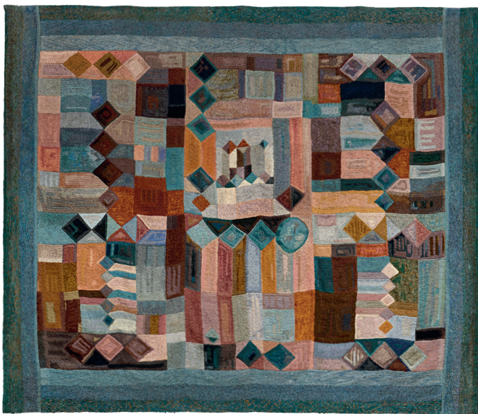
Construcció abstracta [Construcción abstracta], 1965. Art Collection Meierijstad, Países Bajos.

Aurèlia Muñoz se forma como artista de manera intuitiva y autónoma, con la urgencia que imprime un arranque relativamente tardío, al tomar la decisión crucial de consagrarse a la práctica