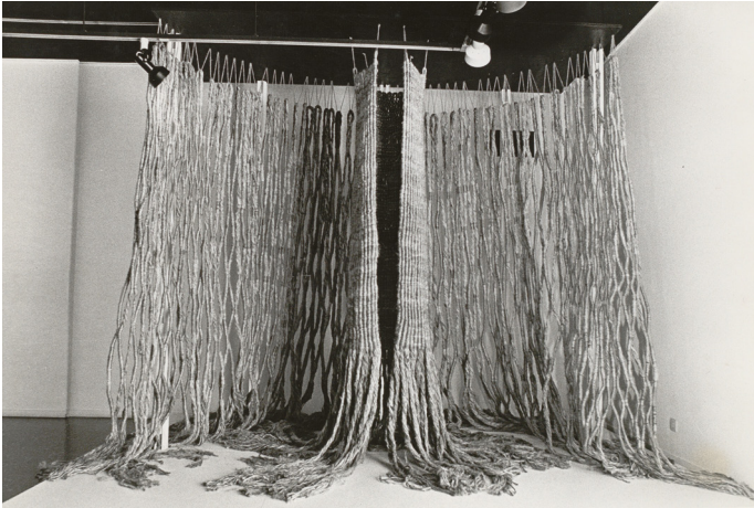
Personatge dins el bosc [Personaje en el bosque], 1974. The National Museum of Modern Art, Kyoto.

Suspendidas en el aire, de manera casi desafiante, hacen pensar en los paños sacros, regios o papales, del pasado; pero Muñoz hace de ellas cuerpos, seres, volúmenes autoportantes o voladores. A través del arte del nudo, la artista explora composiciones plurales y variaciones seriales: Capas , Personatges [Personajes], Macras o, de manera central en su producción, Ens [Entes].