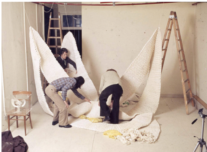
Aurèlia Muñoz instalando la obra Ondulacions [Ondulaciones] en su estudio junto con varias colaboradoras, 1974. Museo Reina Sofía.

personales, maquetas, bocetos y fotografías que desvelan la diversidad de fuentes, la inspiración cosmopolita y el tesón organizativo de Aurèlia Muñoz. Las artes populares como la cestería, la cerámica, la indumentaria y los tejidos figuran entre sus grandes referencias, sobre todo en las investigaciones preparatorias para sus trabajos bordados y de macramé. El uso de recursos documentales se pone de manifiesto no solo en las obras que presentó en numerosas exposiciones individuales y colectivas, sino también en la manera de registrar sus procesos dentro del estudio. También se hace evidente en muchos de los manuscritos, a menudo redactados para conferencias y clases, que se conservan en el Archivo de la artista junto con otros materiales que dan cuenta de su interés por la docencia.