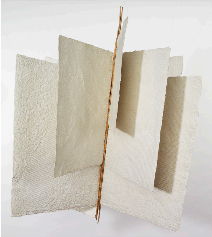
Libre aeri blanc I [Libro aéreo blanco I], 1985. Archivo Aurèlia Muñoz. Cortesía Galería José de la Mano. Fotografía: La Fotogràfica