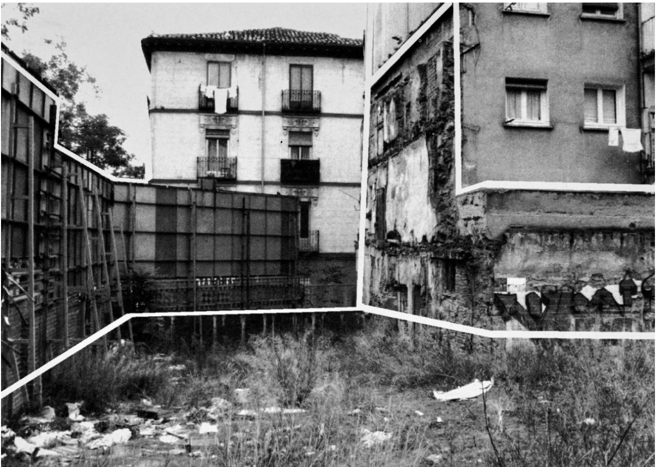
Asociación Cultural Maelström y Red de Lavapiés. Érase una vez Lavapiés y otros cuentos. Paseo de vivienda. Madrid, 2001. Fotografía sin autoría

En el contexto del Máster de Historia del Arte Contemporáneo y Cultura Visual, impartido en el Centro de Estudios del Museo Reina Sofía en colaboración con las universidades Autónoma y Complutense de Madrid (UAM y UCM), se presenta ¿Qué hacemos aquí? Espacios alternativos en Madrid en el cambio de siglo , un ejercicio académico y expositivo a cargo del grupo de estudiantes del itinerario de Teoría y Crítica de Arte.