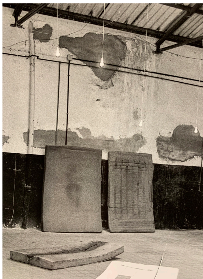
David Hernández, Contradicción , 2001