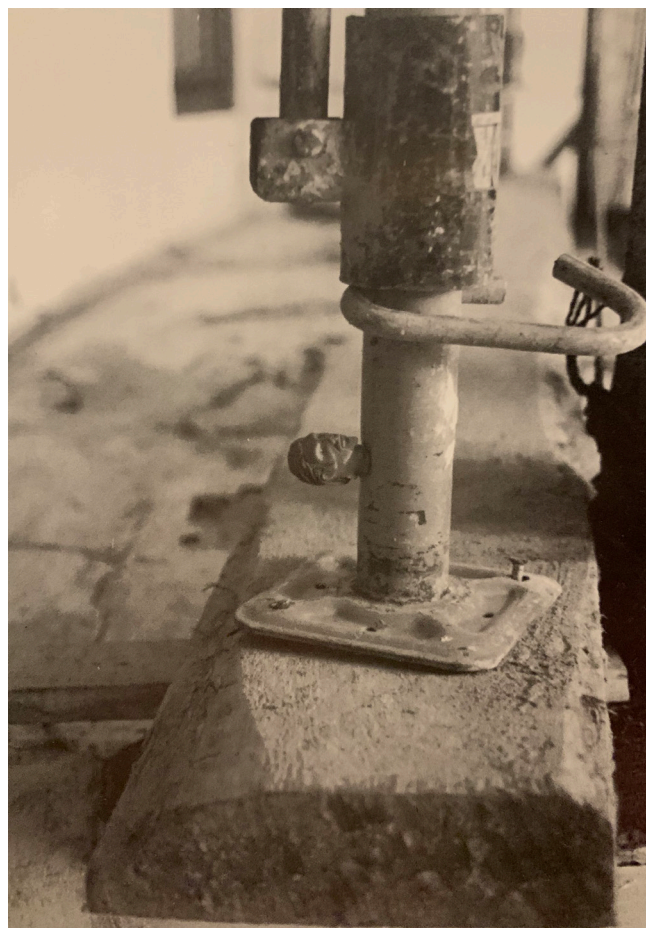
Érase una vez Lavapiés y otros cuentos. Paseo de vivienda, 2001

Garage Pemasa, un taller mecánico en desuso ubicado en el barrio de Salamanca, se inauguró como espacio