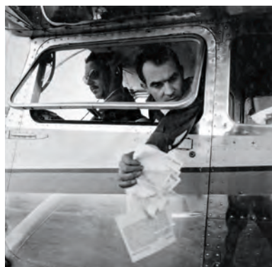
fig. 6. Jean Tinguely lanzando el manifiesto Für Statik , Düsseldorf, 1959