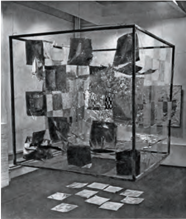
fig. 10. Robert Whitman, Untitled , 1958