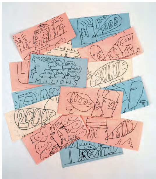
fig. 12. Claes Oldenburg, Ray Gun Money , 120 bills, 1960