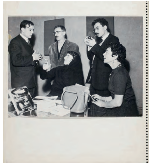
fig. 1. Yves Klein, press book de la Galleria Apollinaire, Milán, 1957

En París, las “propuestas monocromas” de Klein se dieron a conocer en dos exposiciones casi simultáneas, como una constelación variegada de definiciones o, más bien, deconstrucciones. En la celebrada en la galería de Colette Allendy, Pigment pur (Pigmento puro), el “concepto monocromo” de Klein, todavía en curso de evolución, aparecía en distintas versiones: como parte de una escenografía, en forma de mampara azul; como “materia bruta” o “esencia” de la pintura, en forma de bloques de pigmento; como forma desmaterializada, en forma de surtidores puros de fuego (es decir, el modelo más primitivo y crudo de lo espectacular); y como retirada total de la “pintura como objeto” —sustituida por “pintura como concepto palpable”— a través de una sala blanqueada, cuyo “contenido” el artista evocaba mediante una performance . Este concepto, que Klein denominó