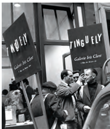
fig. 5. Hombres-anuncio de la exposición Méta-matics de Jean Tinguely en la Galerie Iris Clert de París, julio de 1959

Las Méta-matics de Tinguely, armatostes de acero negro provistos de papel y un rotulador, empezaron a escala de escultura. Un grupo de esas obras, más pequeñas, que permitían al espectador colaborar con el artista para hacer un dibujo o una pintura, se expuso en la Galerie Iris Clert pocos meses antes de la Bienal. Una vez más, Clert impulsó el componente de espectáculo con unos hombres-anuncio que se paseaban por delante de la galería [fig. 5]. También convocó un concurso para el mejor dibujo de Méta-matic . La obra incluía una estampilla que el “espectador-artista” podía utilizar para poner una especie de sello de autenticidad en el reverso del dibujo o pintura, y que decía: “Pintura ejecutada en colaboración con la Méta-matic n° X de Jean Tinguely”, y debajo: “por _____” y otra línea más para la fecha. Ese documento, que modificaba el estatus de la obra y su autoría, era uno de varios que Tinguely vinculó a su práctica por esas fechas.