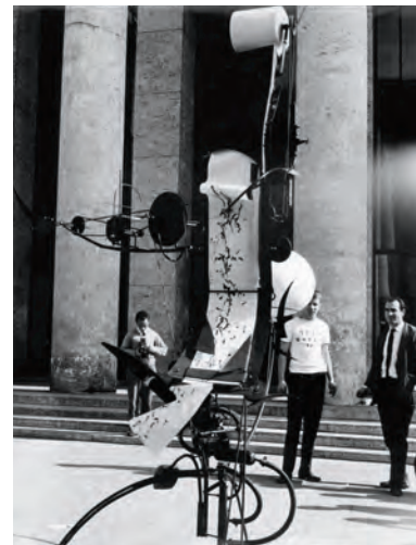
fig. 4. Jean Tinguely con la Méta-matic n° 17 en la Bienal de París, 1959

Unos cuantos periodistas dirigieron observaciones críticas hacia el americano outré Robert Rauschenberg, que había realizado su obra con una corbata, un botón y otros elementos extraños; de manera que algunos empezaron a calificarle de “neodadá”, insinuando que había inventado muy poco 33 . Otros, desinflando el posicionamiento estratégico de Klein, informaron de las ocurrencias de aquel personaje excéntrico, cuya obra llegó envuelta en paños para proteger su rara invención — el pigmento — y que no dejó que nadie más la tocara antes de instalarla 34 . La “estrella” de estas figuras excepcionales, sin la menor duda, fue Jean Tinguely. Su obra apareció en la calle, separada de las demás, como una especie de llamativa apuesta por una nueva clase de escultura. Fue todo un éxito, con Tinguely y su equipo atentos para activar la pieza en la inauguración oficial para el ministro de Cultura André Malraux [fig. 4].