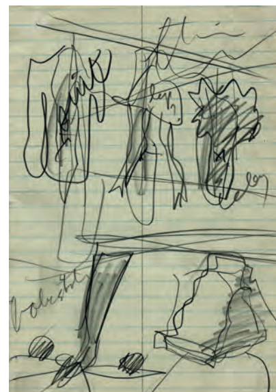
fig. 13. Claes Oldenburg, Hoja de cuaderno: estudio para el montaje de The Store en Martha Jackson Gallery, Nueva York, 1961