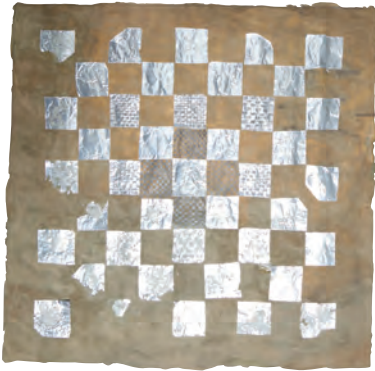
fig. 9. Robert Whitman, Untitled drawing (checkerboard) , 1957