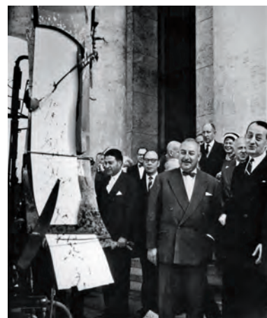
fig. 7. Méta-matic n° 17 en la Bienal de París, 1959