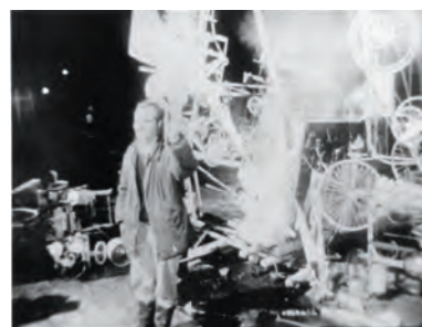
fig. 8. Jean Tinguely, Homage to New York en el Museum of Modern Art de Nueva York, 1960