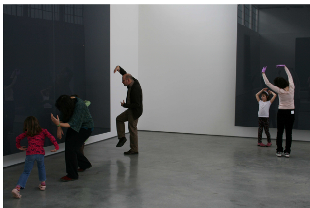
Merce Cunningham Dance Company. Family Day

Dirigido a: Público familiar. Niños entre 6 y 12 años