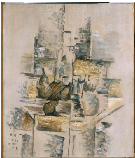
GEORGES BRAQUE Bouteille et fruits (Botella y frutas) , 1911 Óleo sobre lienzo 64,5 x 54,2 cm Museo Nacional Centro de Arte Reina Sofía

Ahora, fruto de este acuerdo de colaboración, el público puede contemplar en las salas 207, 208 y 210 del edificio Sabatini del Museo Reina Sofía una selección más de 70 obras procedentes de los fondos cubistas de las colecciones de la Fundación Telefónica y del Museo Reina Sofía que ponen de manifiesto la gran pluralidad de propuestas creativas que generó esta corriente artística y que dan pie a una lectura más amplia sobre ella.