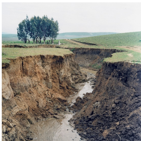
YTO BARRADA El estrecho. Grieta / Derrumbe del cromlech de M'zora , 2001 C-print sobre aluminio 60 x 60 cm Colección de la artista. Sfeir-Semler Gallery y Galerie Polaris

centrar la atención en las realidades sociales locales y globales, a través de proyectos inspirados en el deseo de cambio y de justicia social.