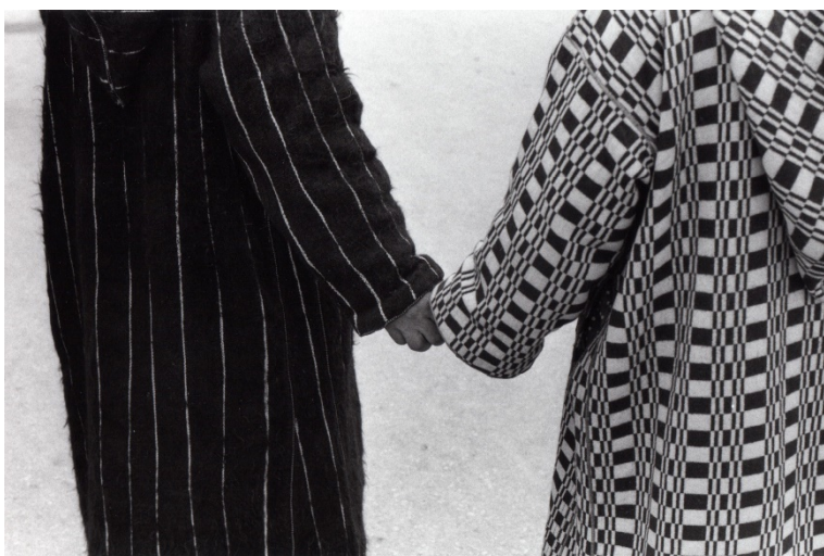
BERNARD PLOSSU Marrakech , 1975 Gelatinobromuro de plata sobre papel 18 x 24 cm Colección del artista © Bernard Plossu

En la segunda etapa, años de grandes conflictos internos, surge una constelación de publicaciones alternativas, festivales y bienales a menudo independientes. La voz de la disidencia, especialmente activa en la literatura, la poesía y el teatro, se difunde mediante la revista Souffles hasta su prohibición en 1972 y, a partir de entonces, en Intégral y Lamalif . Durante este periodo aparece también un arte no académico, no intelectualizado, cuyos representantes son hombres y mujeres autodidactas vinculados a una dinámica artística viva, como es el caso de Chaïbia Talal y Fatima Hassan .