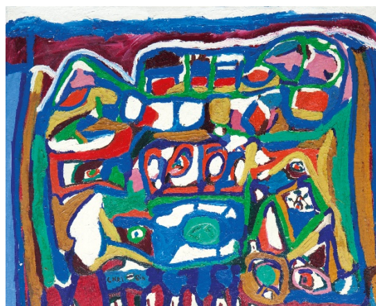
CHAÏBIA TALAL Plaza Jamaâ El Fna , 1969 Óleo sobre lienzo 80 x 100 cm Colección particular, Marrakech © Chaïbia Talal

De aquella época se muestran aquí trabajos como La ceremonia del matrimonio (1983), de Chaïbia Talal , artista que retrata a las mujeres en muchas de sus