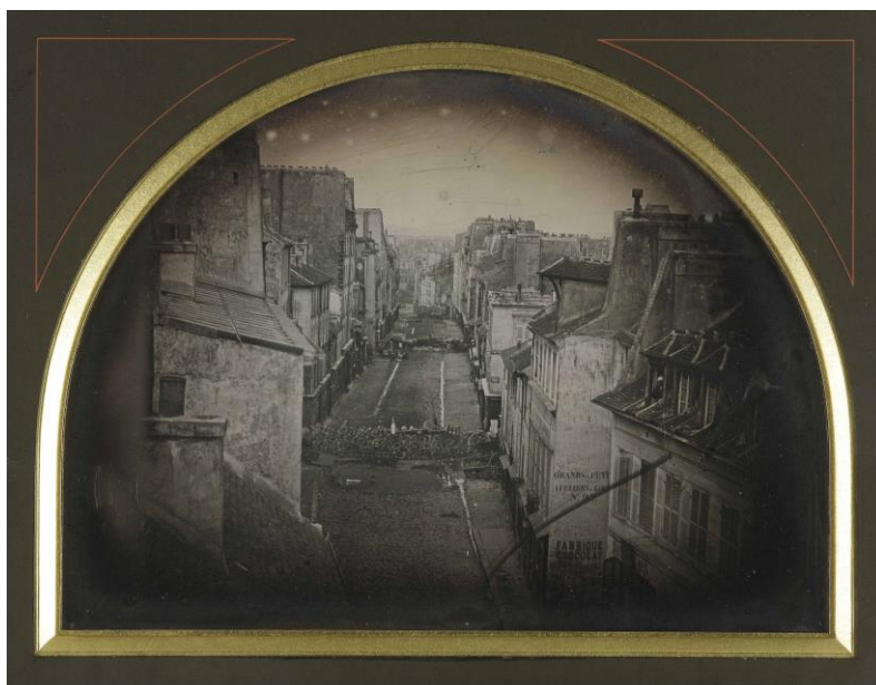
CHARLES FRANÇOIS THIBAUT

También pueden verse aquí imágenes de la primera revolución que ha quedado registrada fotográficamente , la de 1848, cuando el proletariado adquirió conciencia de clase y comenzaron las luchas políticas obreras. Los materiales fotográficos que se conservan de los episodios revolucionarios de 1848 son extremadamente escasos, unos pocos daguerrotipos y calotipos de las barricadas de París, o de eventos y retratos de significación política en Londres.