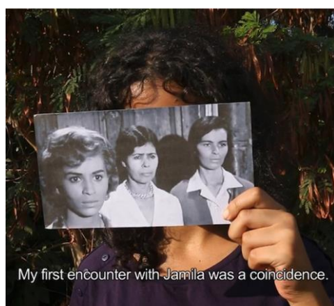
MARWA ARSANIOS Have You Ever Killed a Bear? or Becoming Jamila , 2014 Video monocal, color, sonido. 25:26 min. Edición de 5 + 1 AP

La obra de Maria Thereza Alves (São Paulo, 1961) Uma Possible Reversal of Missed Opportunities (2016) fue producida para la 32ª Bienal Internacional de São Paulo. Alves organizó tres talleres con pueblos originarios con el objetivo de imaginar un futuro descolonizado para el país. Junto a un grupo de universitarios indígenas, produjo 3 carteles para congresos ficticios sobre diversos temas de actualidad, cuyas fechas sugieren que ya se han realizado. A través de los carteles, promueve una discusión en torno a aspectos del saber autóctono ignorados por las instituciones de Brasil y sus investigadores no indígenas. Esta artista, de trayectoria consolidada, aborda en su trabajo cuestiones sobre el territorio, el patrimonio cultural y la historia de la colonización. De trayectoria consolidada, Alves ha expuesto su trabajo en importantes instituciones internacionales y también se encuentra representado en prestigiosas colecciones; a partir de ahora también en el Museo Reina Sofía.