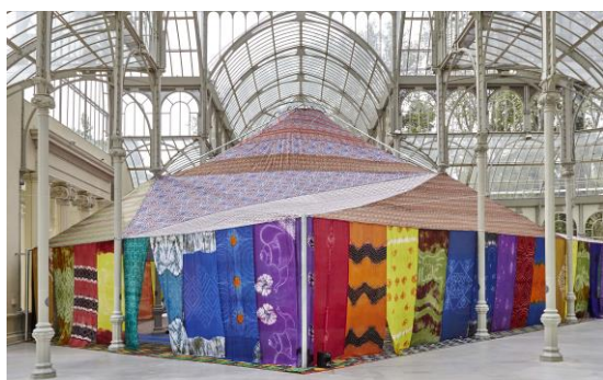
FEDERICO GUZMÁN Tuiza , 2015 Estructura, melifas pintadas para los laterales (230 x 120 cm c/u aprox.), telas triangulares de benia para el techo, 10 colchonetas forradas con tela, alfombras, mobiliario, archivo de las actividades de la Tuiza (disco duro con fotografías y vídeos) Medidas totales: 550 x 900 x 900 cm.

Federico Guzmán (Sevilla, 1964) es el autor de Tuiza , (2015) una instalación a modo de Jaima compuesta por melifas pintadas, telas triangulares de benia para el techo, colchonetas, alfombras y mobiliario, todo ello acompañado de un archivo de las actividades de la Tuiza (disco duro con fotografías y vídeos). Esta estructura efímera, que se produjo en 2015 para la exposición Tuiza , organizada por el Reina Sofía y fue expuesta en el Palacio de Cristal, es una de las obras