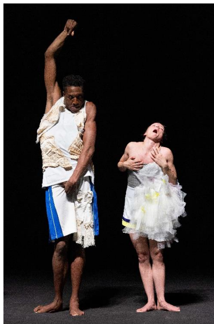
ESZTER SALAMON MONUMENT 0.6: Heterochrony , 2019

El registro en vídeo de la danza fue en su momento una revolución en la historia de este arte, dado que hasta entonces no había más soporte para la danza que el propio cuerpo de los coreógrafos y bailarines, y eso, irremediabilmente, se terminaba perdiendo. En los últimos años, esta práctica ha ganado espacio e incidencia, no solo por su finalidad documentalística, sino porque la danza ofrece una posibilidad de deleite visual que, bien llevada a la pantalla (solo hay que pensar en Pina, la película de Wim Wenders), es incontestable.