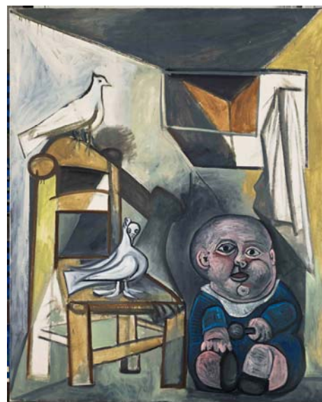
Pablo Picasso, 'Enfant assis sur une chaise', 14 de agosto de 1943, Óleo sobre lienzo, 103 x 130 cm. © RRAA (Grand Palais, Musée national Picasso-Paris) / Mathieu Rabreau, © Susanna Paola Pozzo, VEDAP Madrid, 2018

A partir de 1945, la capital francesa vio llegar un importante número de artistas norteamericanos que huían del ambiente todavía lleno de prejuicios (raciales o sexuales) de los Estados Unidos. Asimismo, muchos artistas latinoamericanos y del Este europeo dejaron sus países por razones políticas. Gracias a la muy activa y publicitada historia bohemia, los recién llegados encontraron en París un aparente ambiente de libertad, libre de prejuicios y de comportamientos académicos tradicionales.