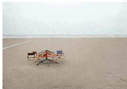
LUIGI GHIRRI Libro di Spina, 1974 Fotografía color. 13 x 19 cm. © Legado de Luigi Ghirri

El programa expositivo arranca el 25 de septiembre con una monográfica dedicada a Luigi Ghirri , uno de los fotógrafos italianos más apreciados de todos los tiempos. Esta exposición, titulada El mapa y el territorio supone el primer estudio significativo de las fotografías de Luigi Ghirri presentadas fuera de Italia.