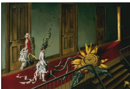
DOROTHEA TANNING Eine Kleine Nachtmusik [Un poco de música nocturna], 1943 Óleo sobre lienzo Tate: Adquirida con la ayuda de Art Fund and the American Fund for the Tate Gallery 1997

El 2 de octubre de 2018 se inaugura Detrás de la puerta, invisible, otra puerta , la primera gran retrospectiva de la surrealista norteamericana Dorothea Tanning , una de las artistas más singulares del siglo XX.