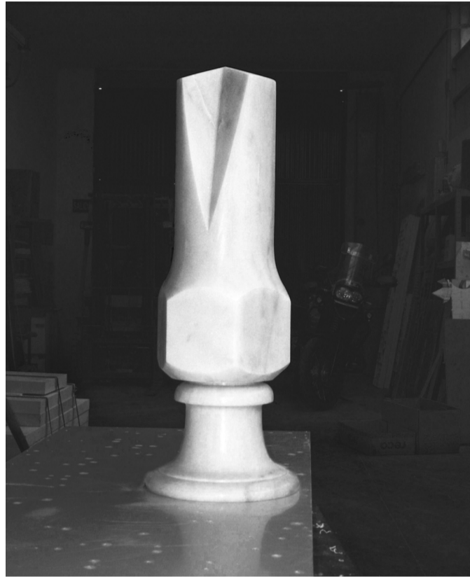
Retrato republicano, 2014

En la república de Moraza el arte es también un proceso de reflexión crítica sobre los dilemas del ornamento (con todo lo que este representa de conflictivo y marginal en relación con la estructura social y cultural) y del monumento como expresión de autoridad en el espacio público. Éste será otro desafío para la interpretación del espectador, constantemente interpelado durante su recorrido por la exposición, en el contexto de su «interpasividad», e invitado a descubrir el «museo republicano» de un artista que siempre ha asumido una clara posición en la querrela abierta entre el barroco y el clasicismo, optando decididamente por las posibilidades libertarias del barroco frente a la alienación puritana de toda depuración formal, artística o política. ■