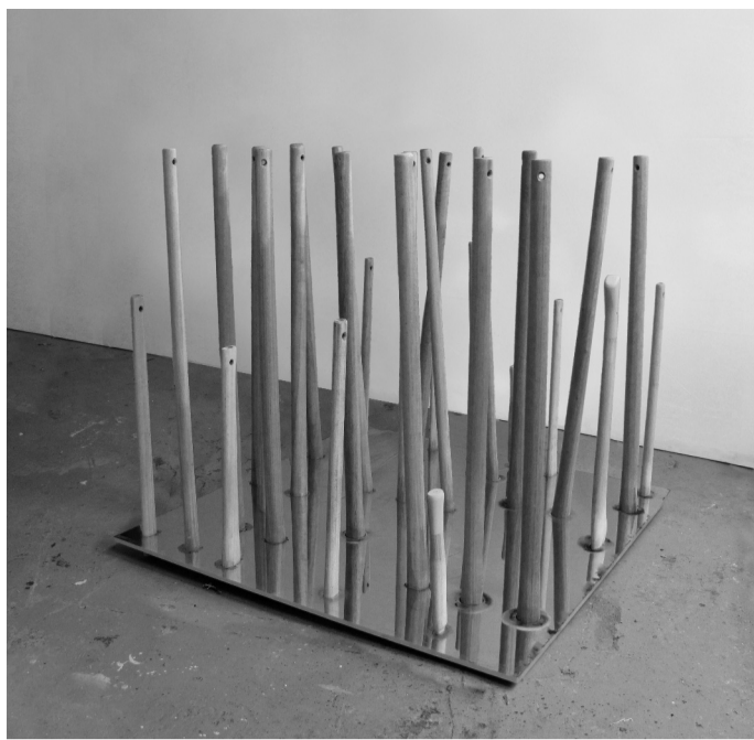
Endscape (anderssendufresne), 2013