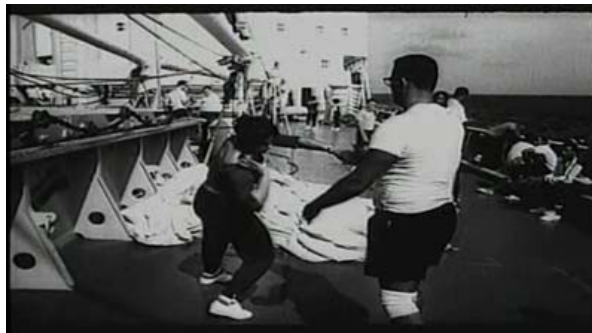
SANTIAGO ÁLVAREZ Cerro pelado , 1966

Esta sesión muestra tres películas de Santiago Álvarez, en las que su característico trabajo de montaje, apropiación y sátira va cobrando forma. Cerro Pelado toma su título del nombre del barco que trasladó a los deportistas cubanos a los décimos Juegos Centroamericanos y del Caribe, celebrados en 1966 en San Juan, Puerto Rico. Al tratarse de una colonia norteamericana, Estados Unidos intentó evitar la participación de la delegación cubana. Se trata de un