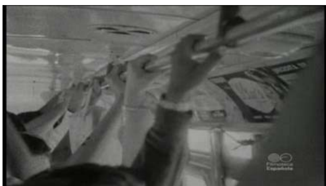
NÉSTOR ALMENDROS Gente en la playa , 1961

Película de 35mm transferida a archivo digital, 1968, VO, b/n, 38'