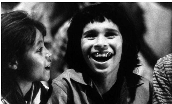
OCTAVIO CORTÁZAR Por primera vez , 1967

Por primera vez es una declaración de amor al cine. Muestra el trabajo de un cine móvil que, con influencia de las Misiones Pedagógicas de los años 30 en España, lleva las películas a una aldea remota por vez primera. En Nuestra olimpiada en La Habana , la Olimpiada en concreto es un torneo internacional de ajedrez en el que José Massip presenta a Fidel Castro como otro jugador más de ajedrez, una figura