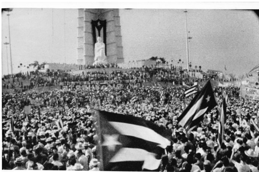
ROBERT DREW et al. Yanki No! , 1960

El Museo Reina Sofía presenta el ciclo Por un cine imposible. Documental y vanguardia en Cuba (1959-1972) , comisariado por el historiador del cine y profesor Michael Chanan , y que está dedicado al movimiento documental cubano en torno a la revolución, un episodio de la vanguardia en América Latina habitualmente poco tratado. El programa, con formatos originales procedentes del ICAIC (Instituto Cubano del Arte e Industria Cinematográficos), se articula en diálogo con la exposición retrospectiva que el Museo dedica al artista Wifredo Lam.