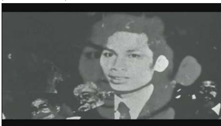
SANTIAGO ÁLVAREZ 79 primaveras , 1969

En 79 primaveras Santiago Álvarez rinde un tributo lírico a Ho Chi Minh. El título hace referencia a la edad del líder vietnamita en el momento de su muerte y se trata de uno de los documentales biográficos más atípicos en la historia del cine. El funeral se presenta acompañado de la música de Iron Butterfly y algunos fotogramas de la película estallan en llamas en la misma pantalla.