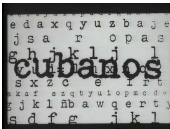
NICOLÁS GUILLEN LANDRIÁN Café Arábica , 1968