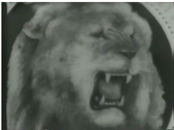
SANTIAGO ÁLVAREZ Noticiero 49 , 1961

Película de 35mm transferida a archivo digital, 1961, VO, b/n, 9'